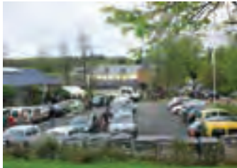
Les parkings et les bords de routes donnent une bonne idée de la fréquentation.

C'est une première et c'est une vraie réussite, tant au point de vue organisation que fréquentation. Le 8 mai dernier, après à peine un peu plus d'un mois de préparation, la journée portes ouvertes de la ferme du Pont de Sains a connu une large affluence du public.