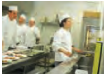
La partie restauration a connu aussi un large succès avec les cuisiniers du Bol Vert