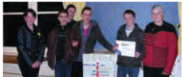
Les élèves de la classe ont été reçus à la Mairie d'Avesnes sur Helpe.

L es élèves de la classe de Melle Bourdin ont gagné le concours d'affiche organisé en 2011 par le comité Téléthon d'Avesnes. Les brochures de la campagne téléthon 2012 de la ville d'Avesnes auront donc pour illustration l'acrostiche imaginé par la dizaine d'élèves.