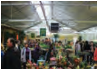
Cette année le nombre de ventes a été record pour un 8 mai dans les serres.