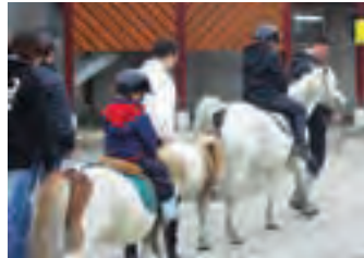
Les baptêmes poney n'ont pas désempilé de la journée : une belle promotion pour l'équitation.