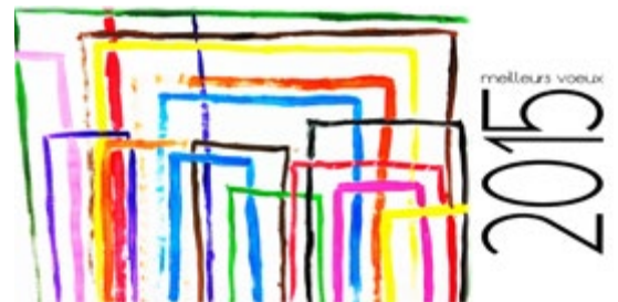
« Trait »