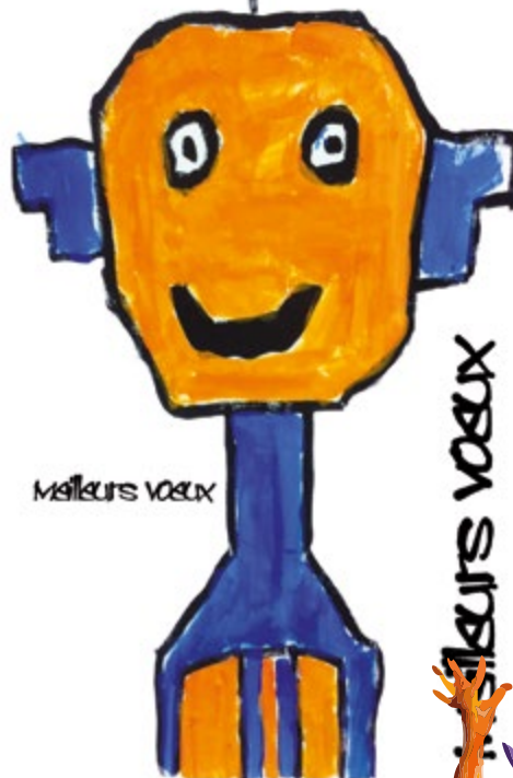
«ROBOT» - production de l'Atelier d'Art-Thérapie de l'Association la Maison des Enfants - Nov. 2014