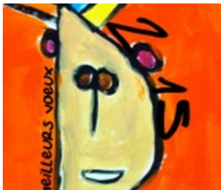
« Bonhomme »