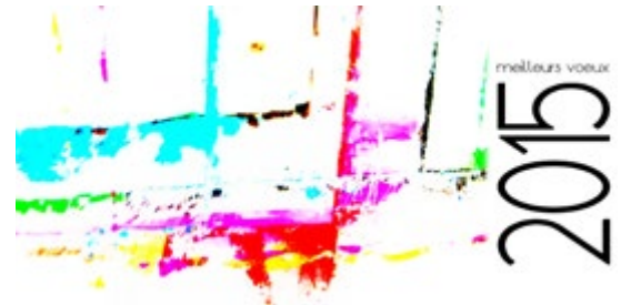
« Trace »