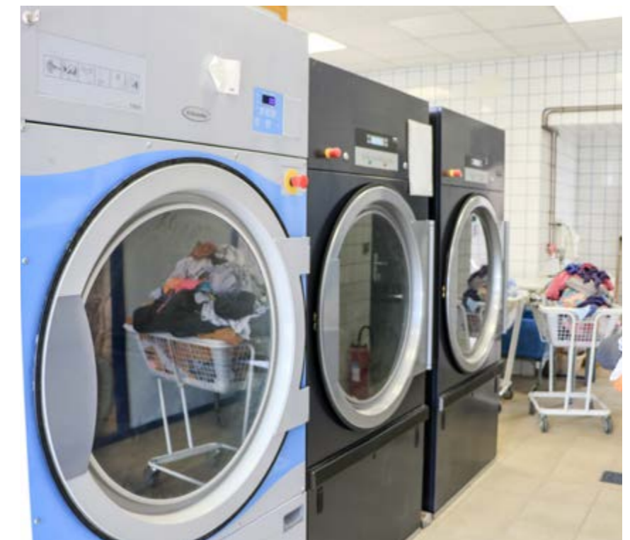
Une fois sortie des machines, le linge propre passe dans les différents séchoirs, avant d'être repassé, trié une deuxième fois et ré-expédié dans les services concernés.