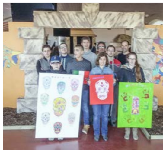
Le groupe de l'IMPro devant les décors de l'exposition à la Capelle