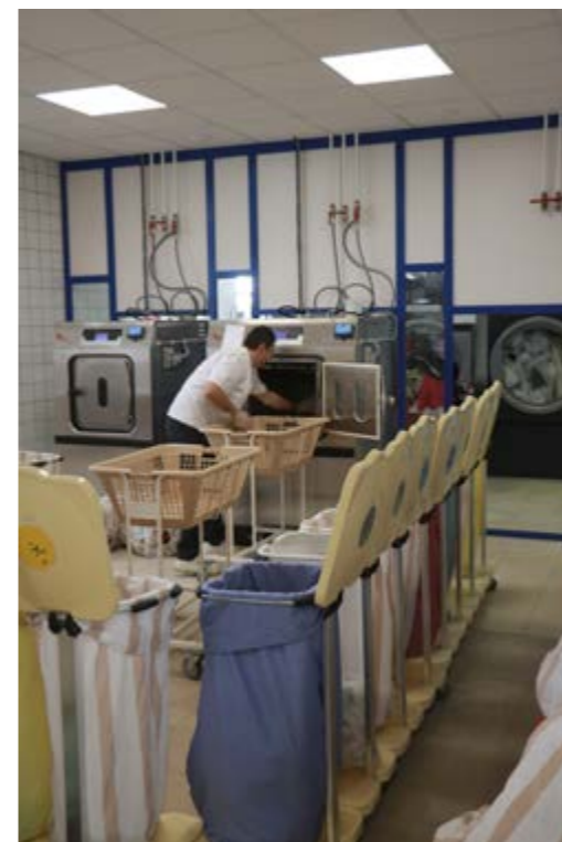
Le linge sale trié est introduit dans la machine à double porte. Une fois lavé, il sera retiré de l'autre côté, « espace linge propre »