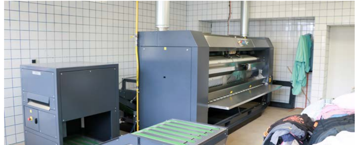
La sècheuse-repasseuse, une machine encore en cours de réglage permet de sécher, repasser et plier le linge plat. Son utilisation demande une adaptation et l'apprentissage de nouvelles compétences. Mais à l'arrivée, quelle économie de temps et de gestes !

par le Président depuis septembre 2015 (cf. article coup de et le réaménagement de la lingerie se poursuit .