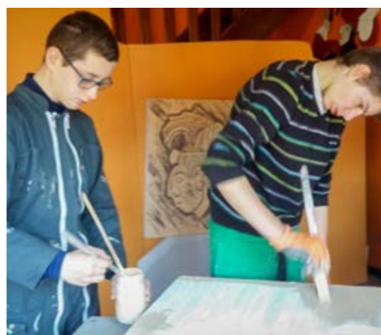
Un travail de fond sur plusieurs mois