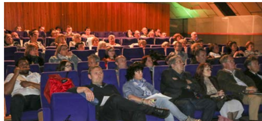
Aperçu de la salle lors de l'assemblée