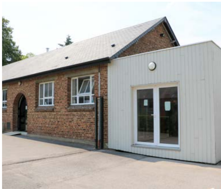
Le nouveau circuit de lavage commence par la porte d'entrée spécifique du local du linge sale

Une impressionnante sècheuse-repasseuse en phase de finalisation d'installation va pouvoir permettre de retraiter l'ensemble du plat (draps, nappes...) actuellement et temporairement confié aux Ateliers du Val de Sambre. Sauf imprévus, ces grands travaux seront terminés pour la rentrée 2017. Malgré tout ce réaménagement, le travail des personnes est toujours essentiel : adaptation aux nouvelles technologies, maintenance, contrôle, tri et répartition, réparations dans des conditions parfois difficiles - quand il fait très chaud par exemple. Reste à terminer, en conformité avec les règles d'accessibilité, les vestiaires hommes/femmes avec douches, le coin couture et le bureau.