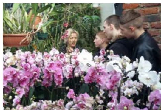
Orchidées et chocolats, exposition du 1er et 2 Avril 2017