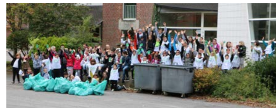
Plus de 130 participants se retrouvent chaque année dans la bonne humeur pour s'associer à ce geste citoyen : « nettoyer la nature » (à gauche l'opération de la MECS, à droite le rassemblement de septembre).