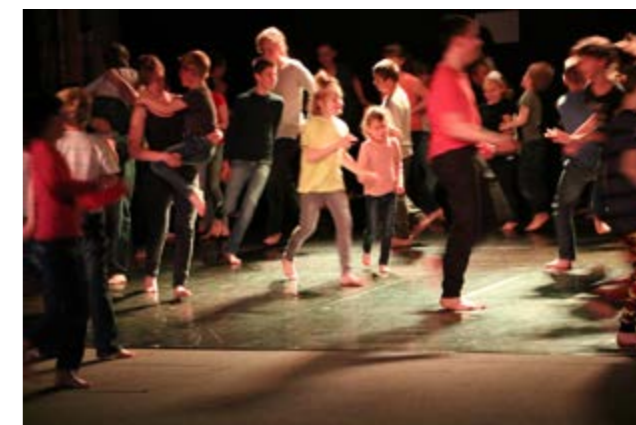
Les enfants de l'atelier d'Art Thérapie ont représenté leur spectacle « Vibrato »

À 15 heures, la journée se clôture avec le sentiment d'avoir partagé un bon moment tous ensemble.