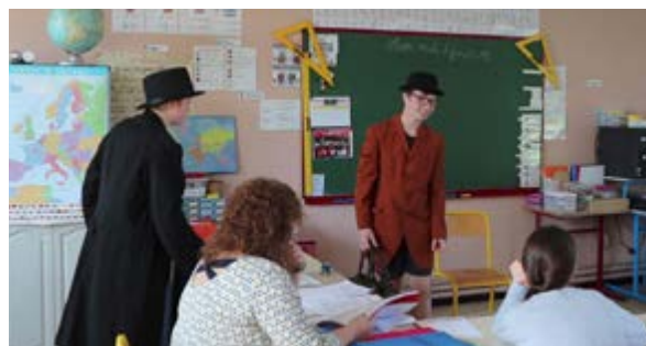
Répétition de la pièce «le tour du monde en 80 jours» adaptée et jouée par les élèves de Mme Bourdin lors de la fête de l'UE du 26 juin. Ci-dessous exemple d'un plan de mise en scène.