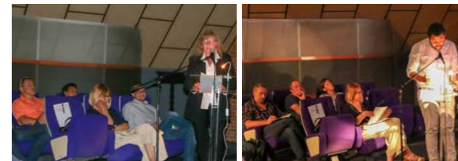
Une partie des intervenants du pôle : cadres et personnel éducatifs