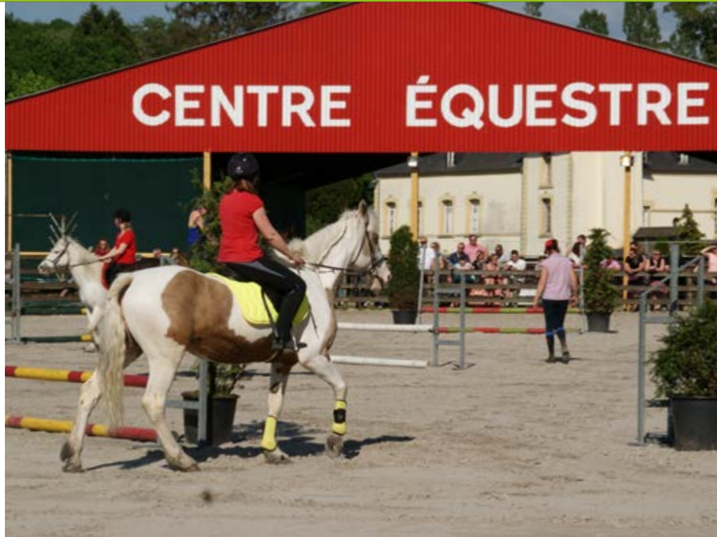
Démonstration équestre lors des dernières portes ouvertes de la Ferme du Pont de Sains, le 8 mai 2018