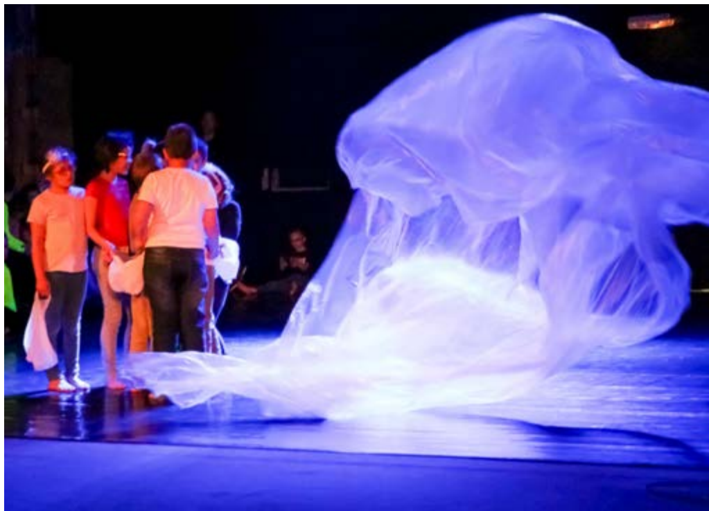
Spectacle de danse donné par les enfants dans la salle de théâtre le 26 avril 2018 lors des premières portes ouvertes pour les parents de l'IME de Trélon