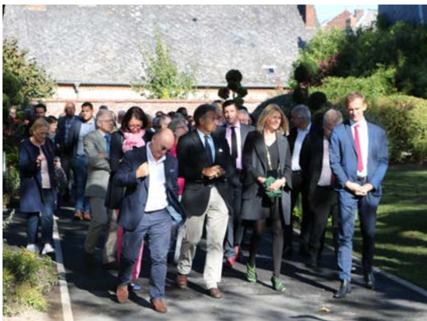
Une centaine de personnes étaient présentes lors de la visite des locaux qui a été suivie par les discours et un cocktail