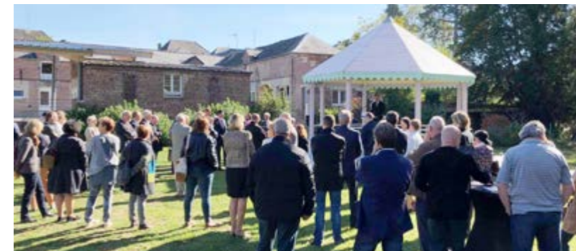
Près d'une centaine de personnes étaient présentes ce 5 octobre pour les discours officiels sous un temps quasiment estival.