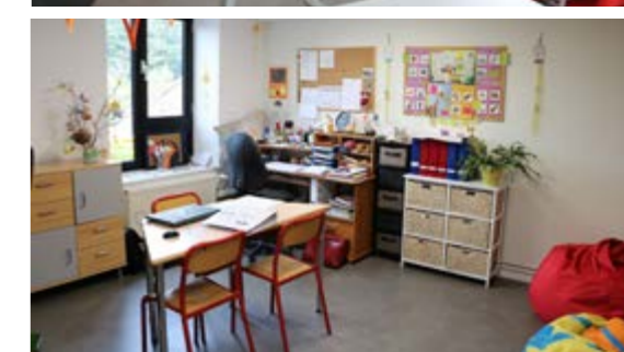
De haut en bas : la nouvelle salle de psychomotricité, le bureau de la psychologue et le bureau des éducatrices.