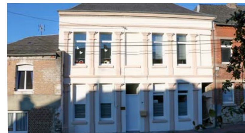
La façade du SESSAD, entièrement rénovée et repeinte

Pour le SESSAD , les travaux de rénovation concernaient : l'amélioration des conditions d'accueil des usagers et des familles (confidentialité) ; l'amélioration de l'accessibilité des locaux ; l'adaptation des espaces de travail aux spécificités du service.