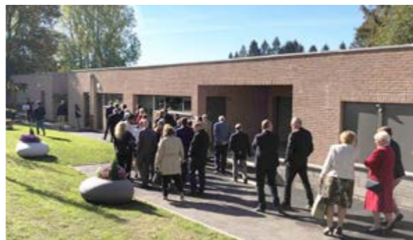
Arrivée des visiteurs dans les nouveaux locaux des ateliers de l'IME

Cette création-rénovation a impliqué des travaux de démolition et reconstruction de l'ancien bâtiment (serres et salle d'étude) sur le même lieu ; l'aménagement des locaux (hall d'entrée, local de rempotage, petite serre, locaux de stockage, blocs sanitaires, vestiaires, bureau éducateur, salle pédagogique) ; le déplacement de l'atelier polyvalence des métiers du bâtiment ; la création d'une aire de stockage déchets verts en extérieur.