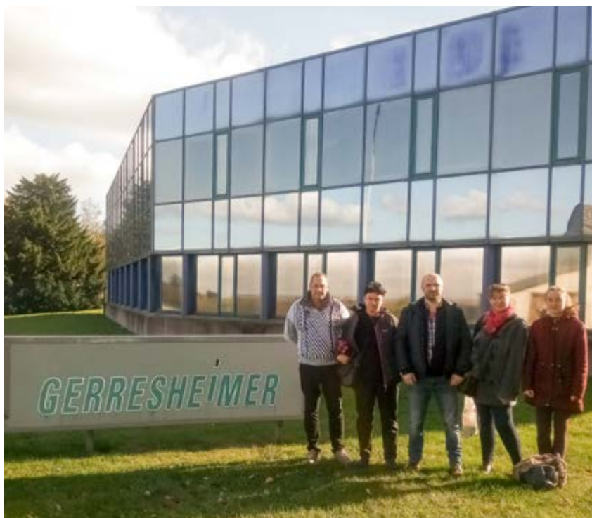
L'équipe de cuisine de l'ESAT devant les locaux de GERRESHEIMER, à Momignies

Après un diagnostic approfondi des fonctionnements et organisation dans l'entreprise, nous avons étudié la faisabilité économique, technique et ... administrative. Il a donc fallu que l'équipe de la cuisine centrale adapte sa production et son organisation pour répondre à ce nouveau marché, négocier avec l'entreprise pour que des travaux soient réalisés dans le self afin de le rendre conforme et enfin, effectuer maintes démarches administratives pour la création de ce projet unique d'atelier hors les murs d'ESAT en Belgique.