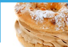
PARIS-BREST - 1909

En forme de roue pour les coureurs cycliste