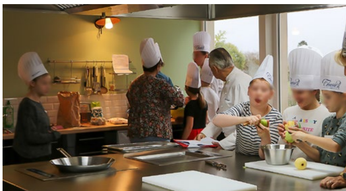
Les enfants dans la cuisine éducative de l'IME de Trélon, en pleine préparation (2019)

Le 12 mai prochain, un concours de pâtisserie organisé pour les enfants des 2 IME de l'Association et les élèves du Lycée Hôtelier d'Avesnes sur Helpe Jessé de Forest, aura lieu sur le site de Trélon, dans la droite ligne du premier concours « du Trophée de la Toque d'or », pour l'inauguration de la cuisine éducative de l'IME en 2019.