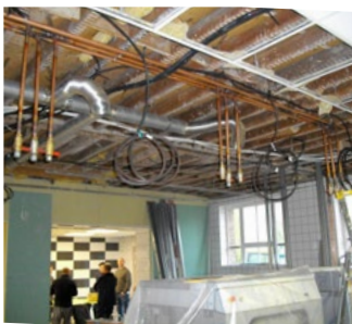
Ci-dessus, la lingerie Huda : même endroit à deux stades d'avancement des travaux.