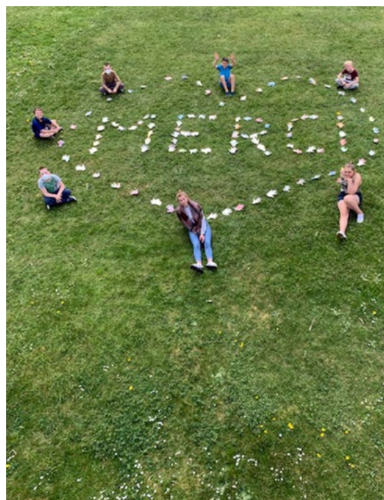
Un grand «MERCI» avec les « mains de la solidarité », projet réalisé par les enfants confinés sur le site de Trélon

Cette situation réaffirme le sens de notre mission première : accompagner, protéger et accueillir les enfants et les adultes qui ont besoin de nous.