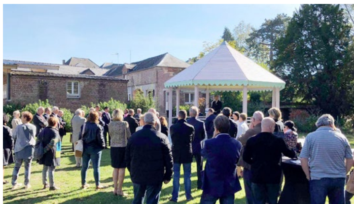
Une inauguration aux allures festives dans les locaux de l'IME