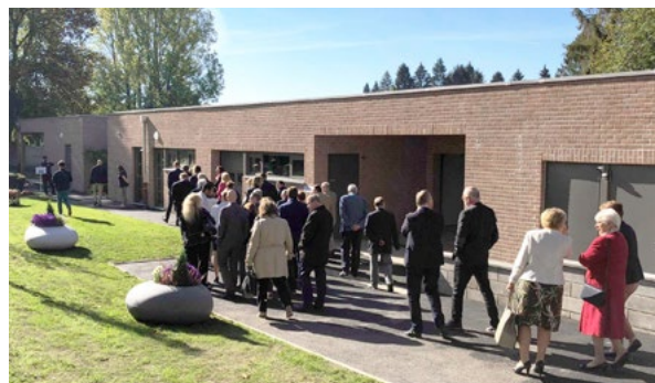
Arrivée des visiteurs dans les nouveaux locaux des ateliers de l'IME

Financement des travaux : ARS (crédits non reconductibles) et fonds propres