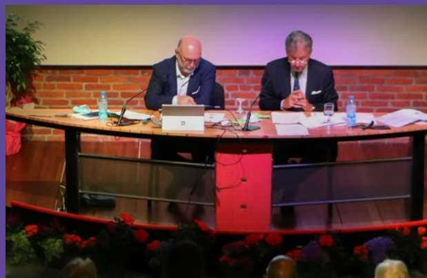
Assemblée Générale 2021