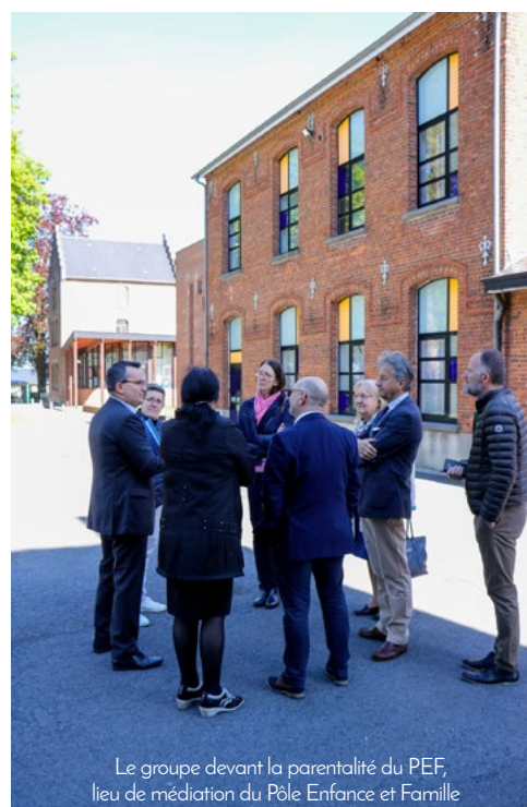
Le groupe devant la parentalité du PEF, lieu de médiation du Pôle Enfance et Famille