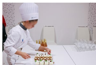
Un buffet de mignardises et confiseries préparé par les élèves du Lycée Jessé de Forest : une autre récompense après l'effort !