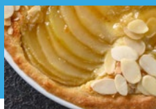
Tarte AMANDINE - 1850

En forme de roue pour les coureurs cycliste