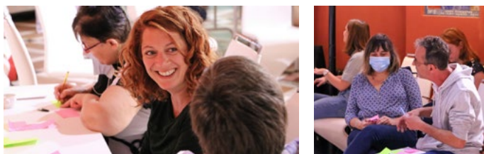
Les groupes d'expression Qualité de Vie au Travail (QVT) ont pu commencer à se réunir dès le jeudi 18 juin 2020

C e premier semestre de l'année 2020 a bousculé nos habitudes de travail mais aussi nos vies. Nous avons dû tous nous adapter, composer avec de nouvelles règles, prendre du recul et nous concentrer sur l'essentiel. Grâce à nos efforts conjugués, nous avons poursuivi l'accompagnement des enfants et des adultes en toute sécurité.