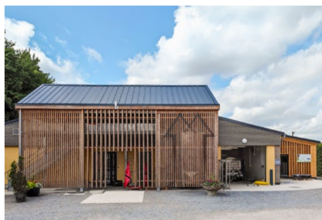
La nouvelle fromagerie est installée dans l'ancienne étable de la Ferme du Pont de Sains à Féron, entièrement transformée pour cette fonction.

La fromagerie incarne une forme d'engagement associatif : pour le respect de l'environnement et pour le tissu socio-économique local. Le projet illustre la détermination à créer des initiatives durables et bénéfiques pour tous, dans la vision d'une économie à la fois sociale, solidaire et respectueuse.