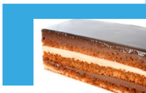
OPÉRA - 1955

Des desserts inventés dans le siècle dernier voire plus qui ont connu et connaissent encore un grand succès auprès des gourmands de tout âge.