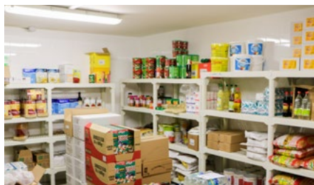
Ci-dessus, création et mise au normes dans la cuisine centrale Ci-dessous, travaux de rénovation dans l'infirmérie.

L'équipe d'entretien et travaux, une mécanique bien huilée !