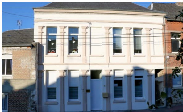
La façade du SESSAD, entièrement rénovée et repeinte

Financement des travaux : ARS (crédits non reconductibles)